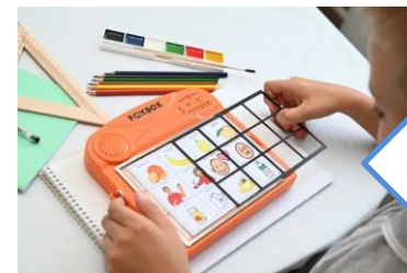
Коммуникатор Fox Vox

Коммуникатор Fox Vox — простое и эффективное устройство для альтернативной и дополнительной коммуникации (АДК). Устройство предназначено для усвоения, развития или восстановления речевых навыков с помощью педагога и самостоятельно. Оно выполняет функции речевого тренажера и средства для элементарной речевой коммуникации.